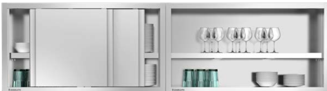
Modèles disponibles équipés d'un éclairage LED